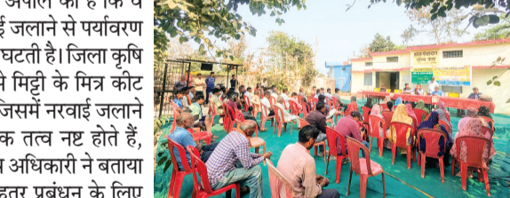
नरवाई जलाने पर जुर्माना, आधुनिक तरीके अपनाएं

नर्मदापुरम। कृषि विभाग ने किसानों से अपील की है कि वे खेतों में फसल अवशेष न जलाएं। नरवाई जलाने से पर्यावरण प्रदूषण होता है और भूमि की उर्वरा शक्ति घटती है। जिला कृषि अधिकारी के अनुसार, नरवाई जलाने से मिट्टी के मित्र कीट नष्ट होते हैं और भूमि सख्त हो जाती है। जिसमें नरवाई जलाने के नुकसान वायु प्रदूषण बढ़ता है, पोषक तत्व नष्ट होते हैं, अग्नि दुर्घटनाएं हो सकती हैं। जिला कृषि अधिकारी ने बताया कि विभाग ने किसानों को नरवाई के बेहतर प्रबंधन के लिए आधुनिक कृषि यंत्रों के उपयोग की सलाह दी है जिसमें किसान हैपी सीडर/सुपर सीडर का उपयोग, मल्ट्रच और रोटावैटर का उपयोग एवं वेस्ट डीकंपोजर का छिड़काव करें। बताया गया कि यदि कोई किसान नरवाई जलाते हुए पाया जाता है, तो उसके विरुद्ध वैधानिक कार्यवाही की जाएगी और जोत की श्रेणी के अनुसार 02 एकड़ से कम 2,500 रुपये, 02-05 एकड़ 5,000 रुपये एवं 05 एकड़ से अधिक 15,000 रुपये जुर्माना वसूला जाएगा।