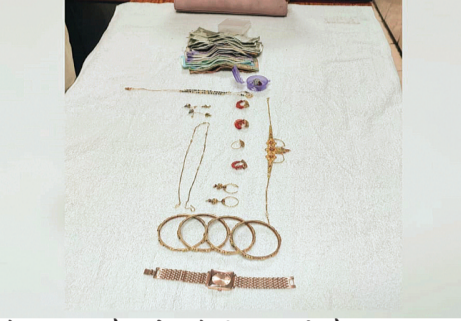
से भरा हाथ बैग कोच में ही भूल गई और अन्य सामान लेकर उतर गई।